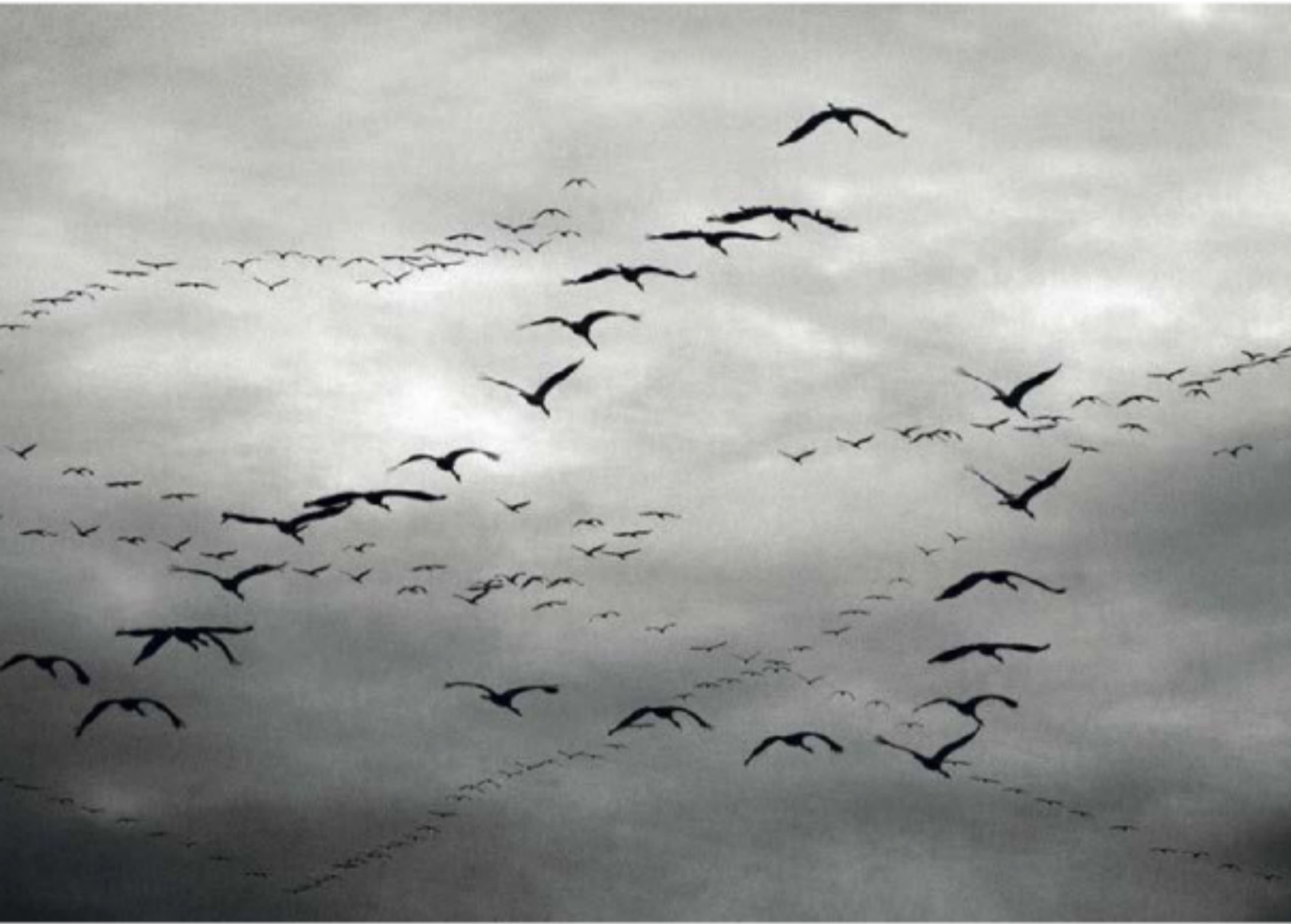
Michel Riehl Lauréat Photo animalière