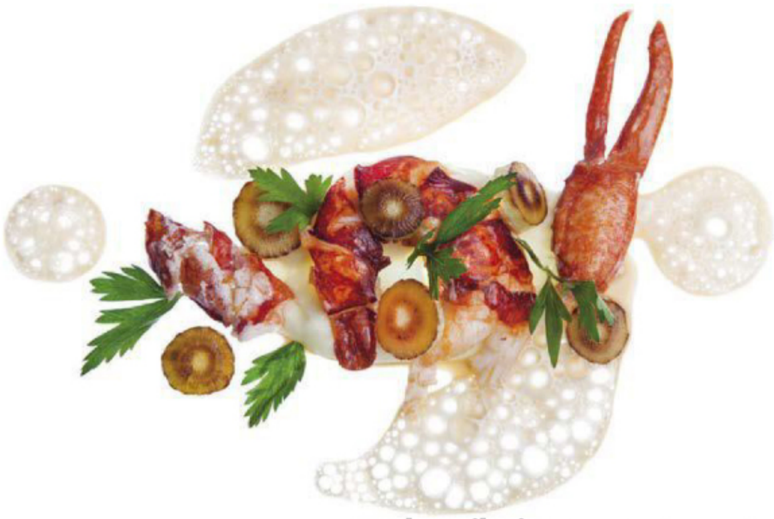
Pedro Ribeiro Lauréat Photo culinaire